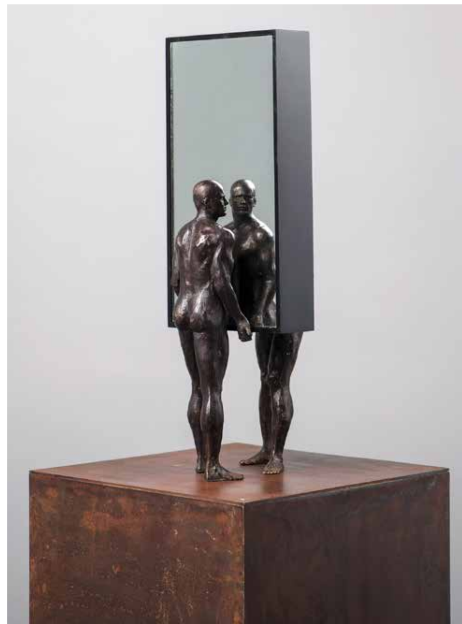
Levante doble | Serie Empujes 2.0 | Bronce + Fierro + Plástico + Espejo | 2024