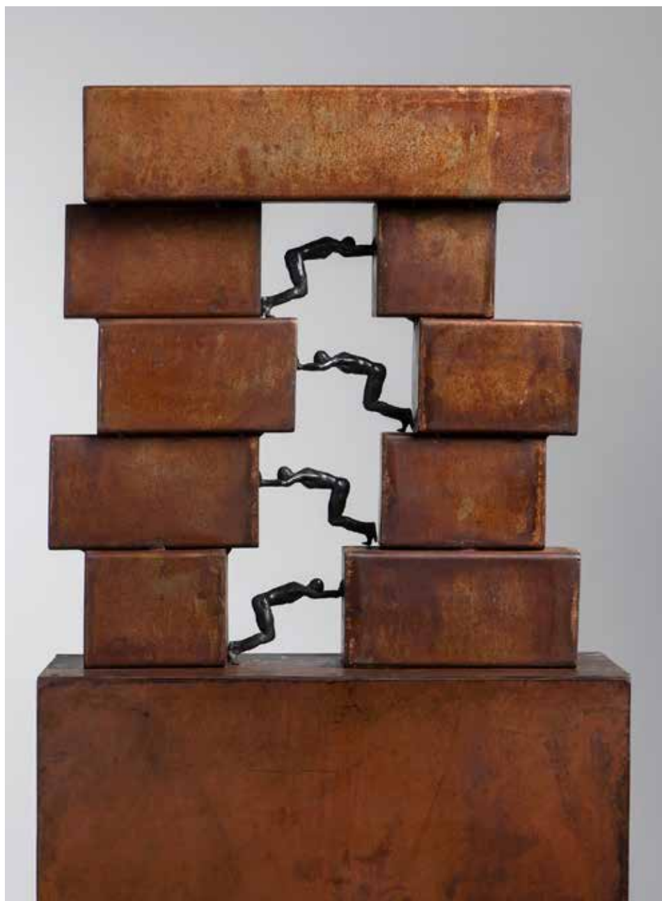
Compresión #2 | Serie Compresiones 2.0 | Bronce + Fierro | 2024