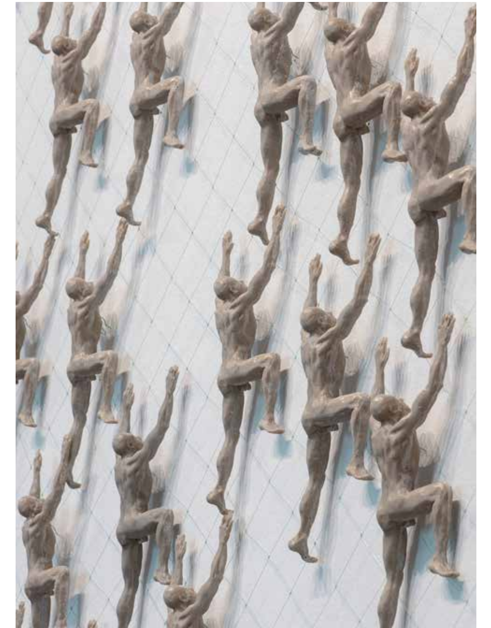
Instalación escaladores | Resina poliéster | 200 figuras, medidas variables | 2024