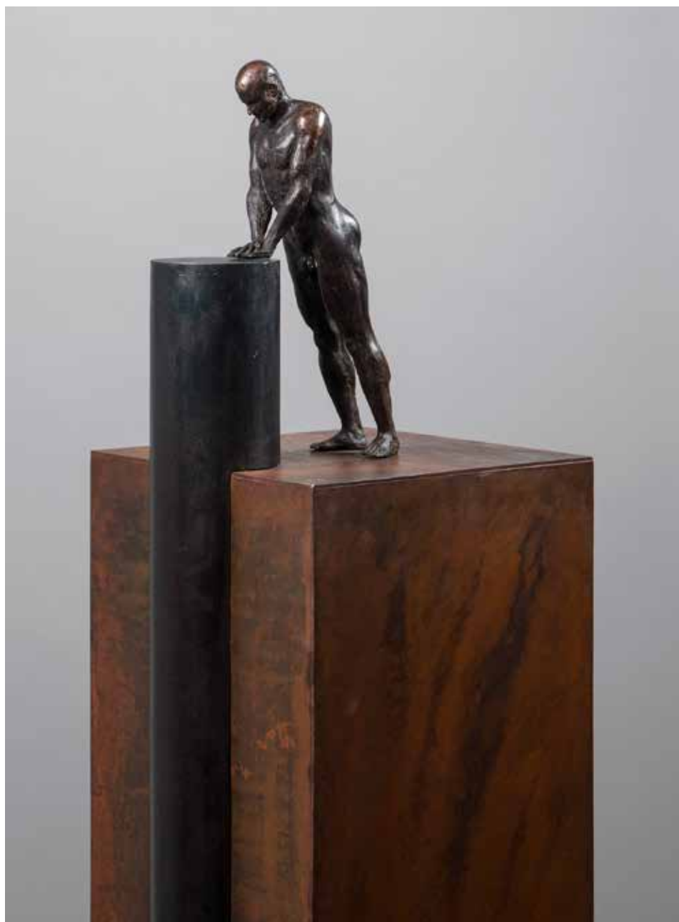
Empuje abajo | Serie Empujes 2.0 | Bronce + Fierro | 2024