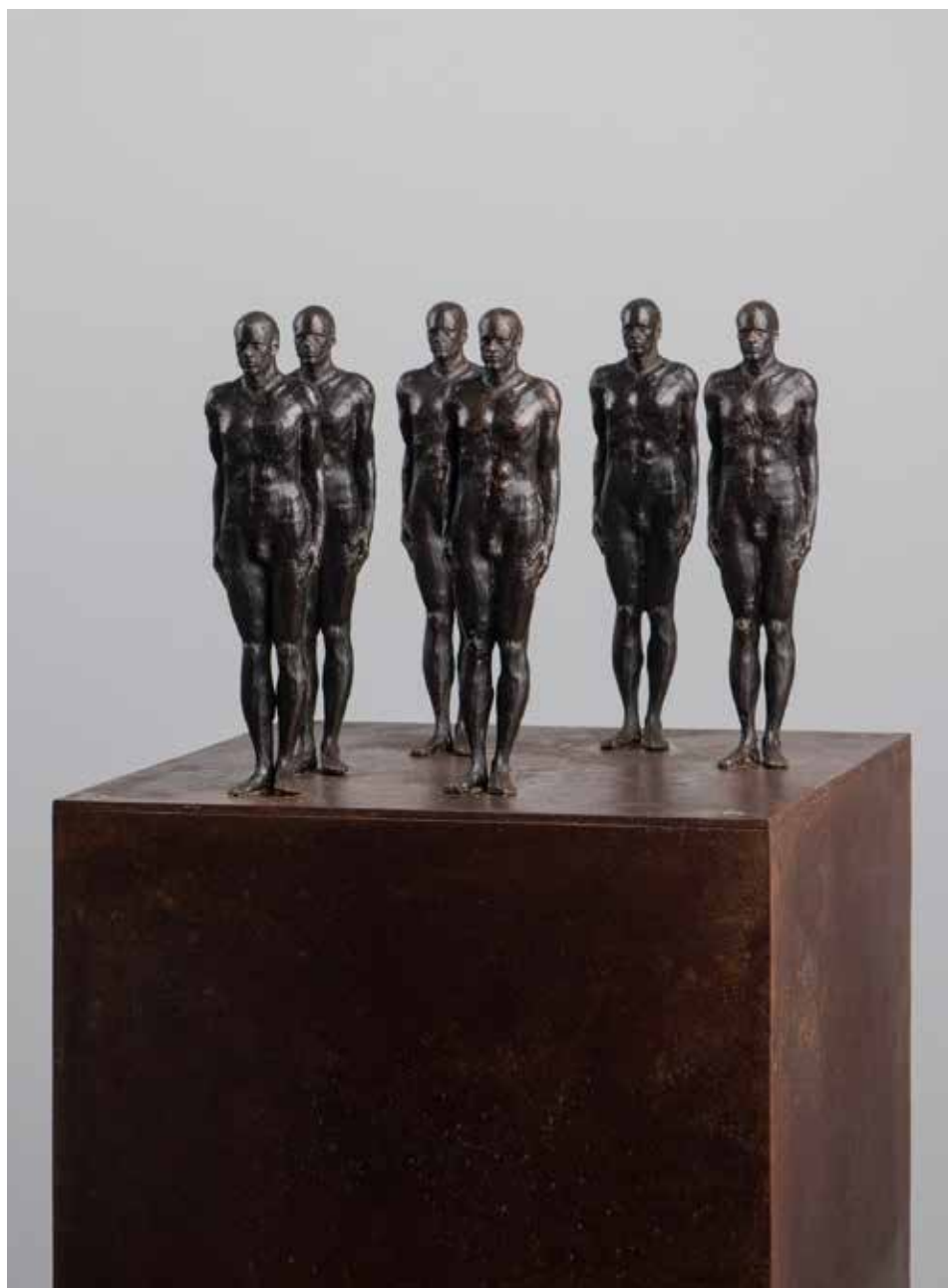
Conjunto #1 | Serie Pi 2.0 | Bronce + Fierro | 2024