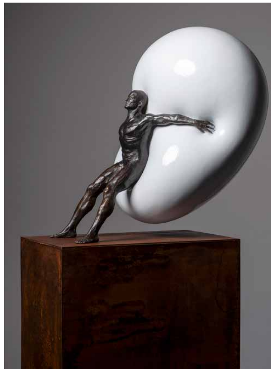
Empuje atrás | Serie 885 Millibares 2.0 | Bronce + Resina poliéster + Fierro | 2024