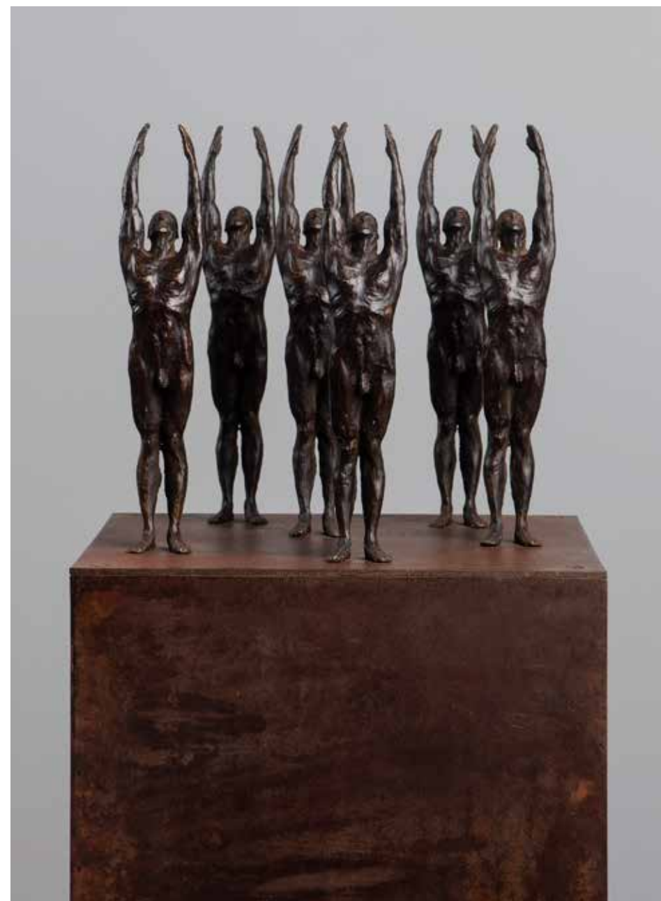
Conjunto #2 | Serie Pi 2.0 | Bronce + Fierro | 2024