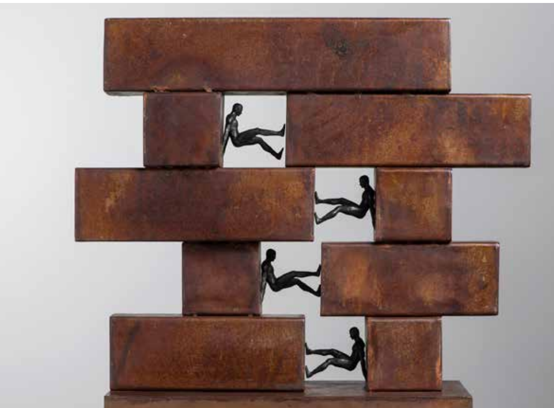
Compresión #1 | Serie Compresiones 2.0 | Bronce + Fierro | 2024