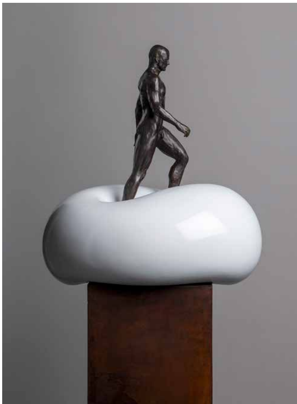
Caminante | Serie 885 Millibares 2.0 | Bronce + Resina poliéster + Fierro | 2024