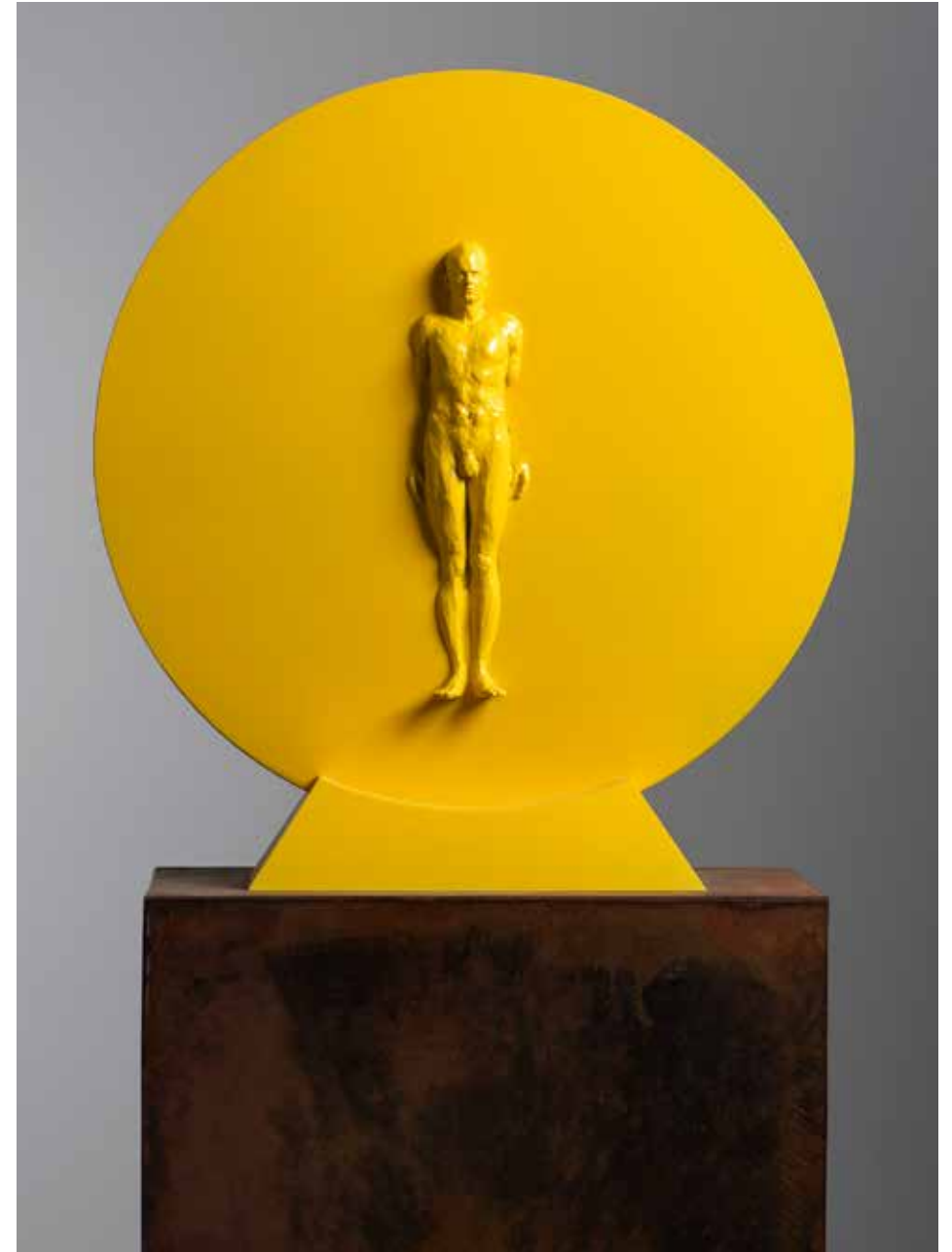
Medallón | Serie Titanes del Ring 2.0 | Mdf + Resina Poliéster + Pintura acrílica | 2024