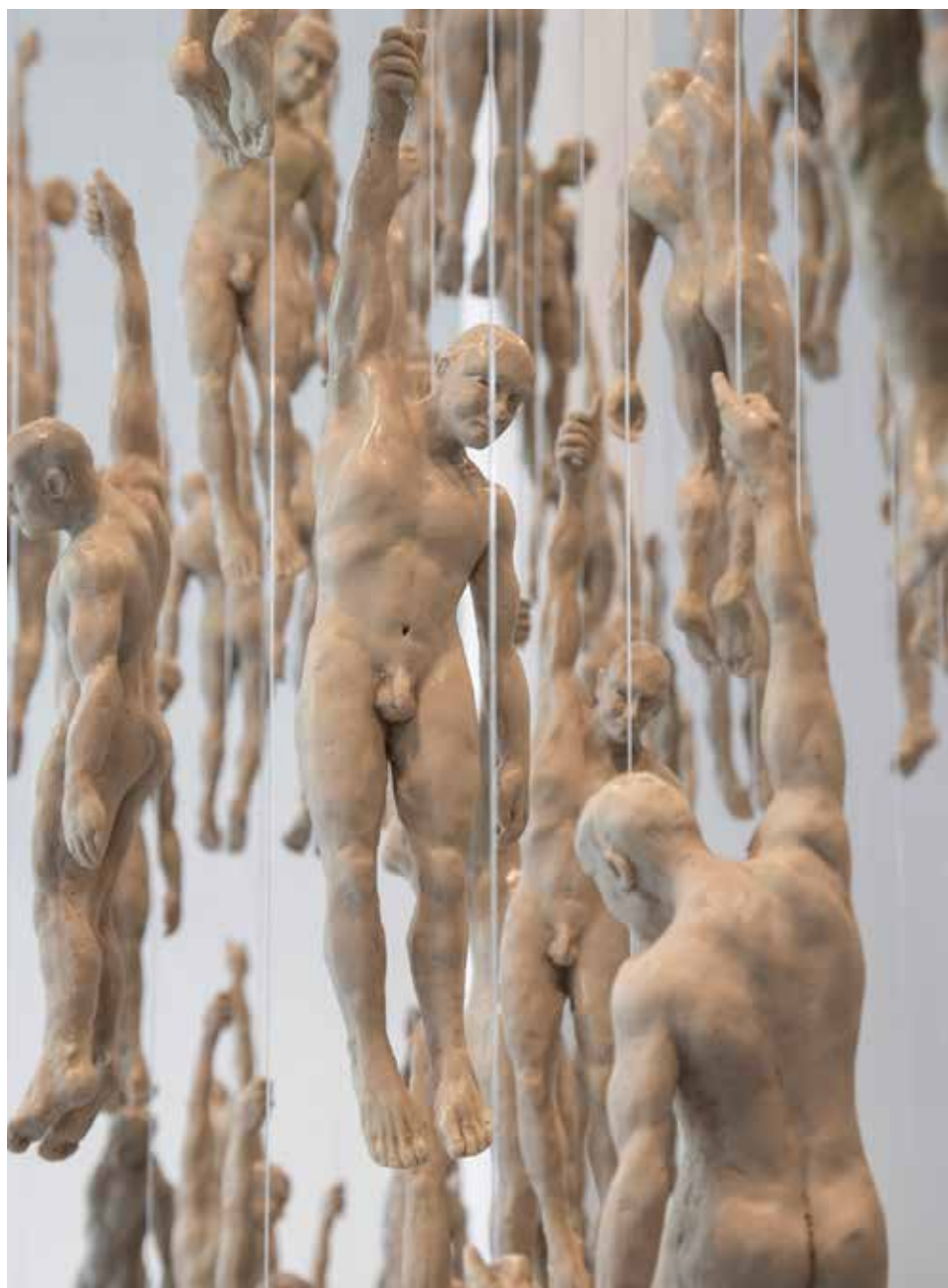
Instalación colgados | Resina poliéster | 160 figuras, medidas variables | 2024