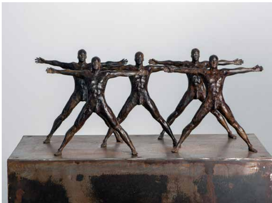
Conjunto #3 | Serie Pi 2.0 | Bronce + Fierro | 2024