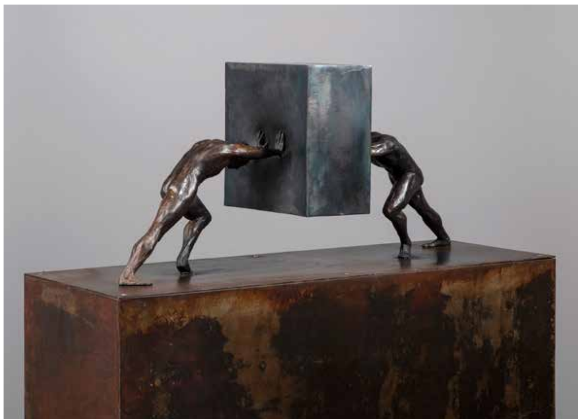
Empuje extendido doble | Serie Empujes 2.0 | Bronce + Fierro | 2024