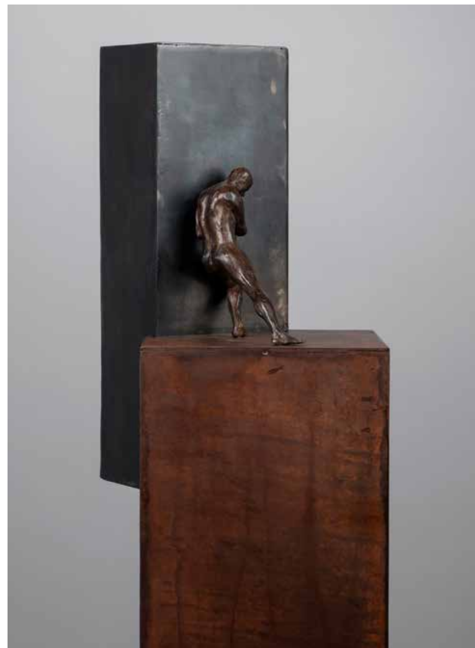
Empuje | Serie Empujes 2.0 | Bronce + Fierro | 2024