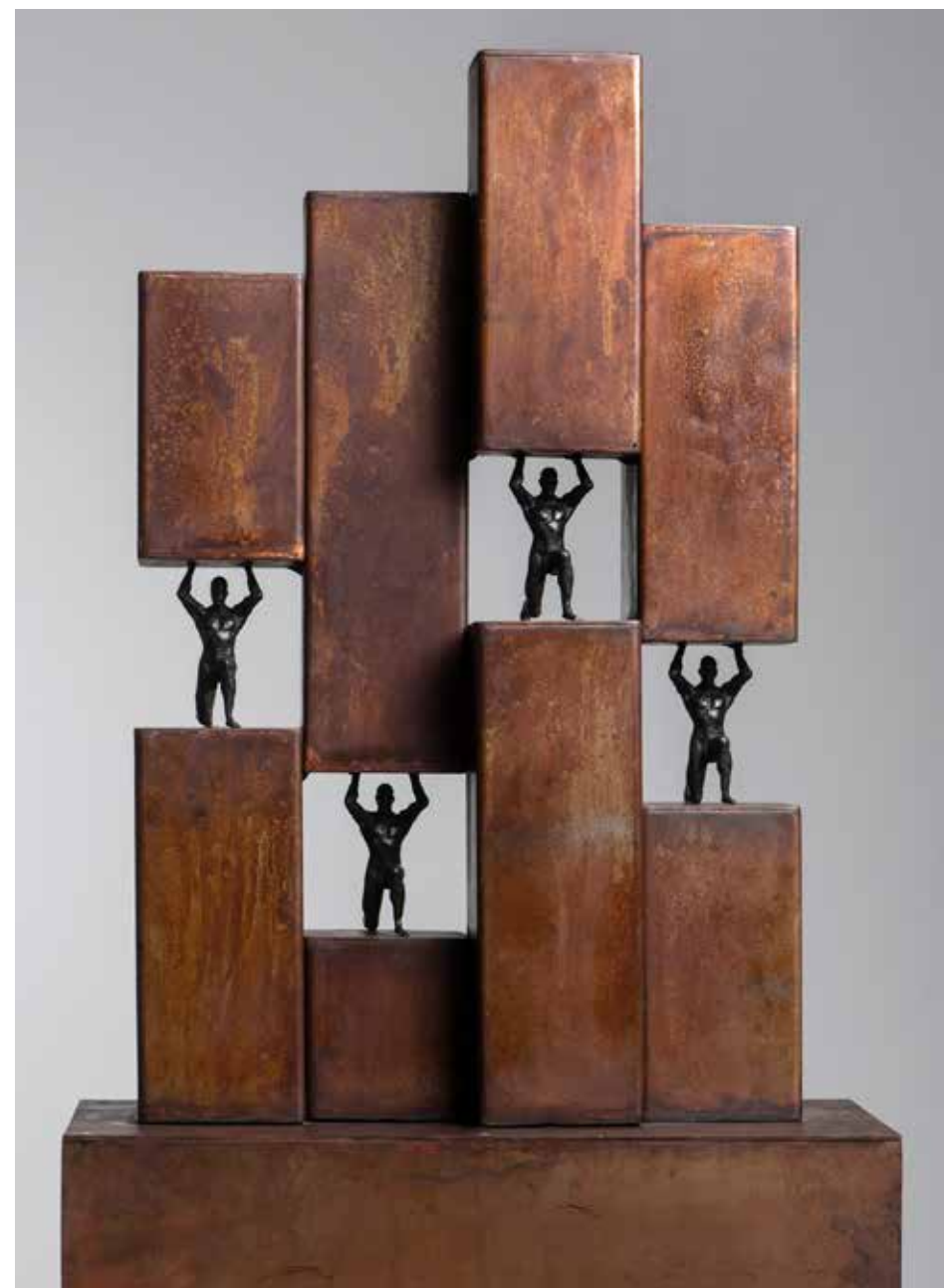
Compresión #3 | Serie Compresiones 2.0 | Bronce + Fierro | 2024