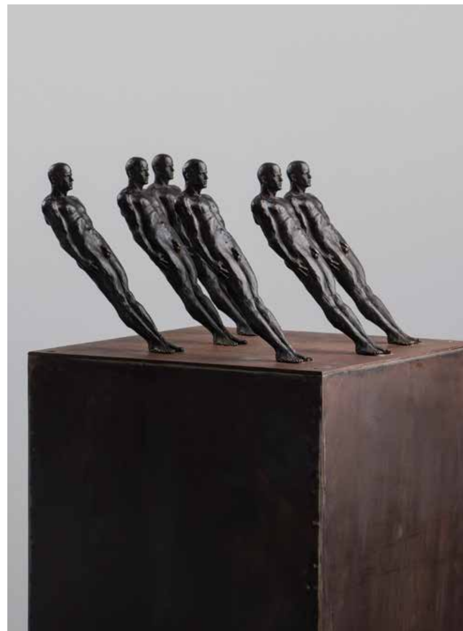
Conjunto #6 | Serie Pi 2.0 | Bronce + Fierro | 2024