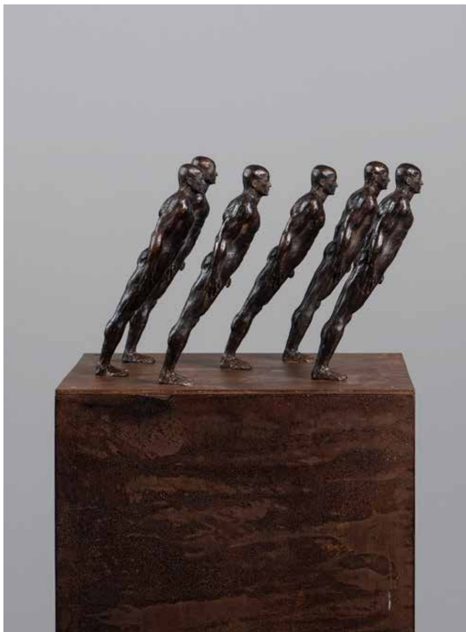
Conjunto #5 | Serie Pi 2.0 | Bronce + Fierro | 2024