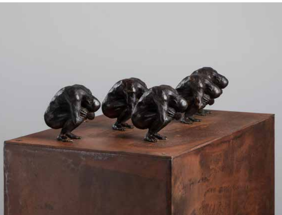
Conjunto #4 | Serie Pi 2.0 | Bronce + Fierro | 2024